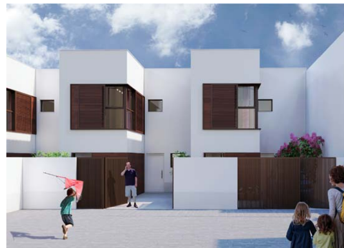
INFOGRAFÍAS NO VINCULANTES