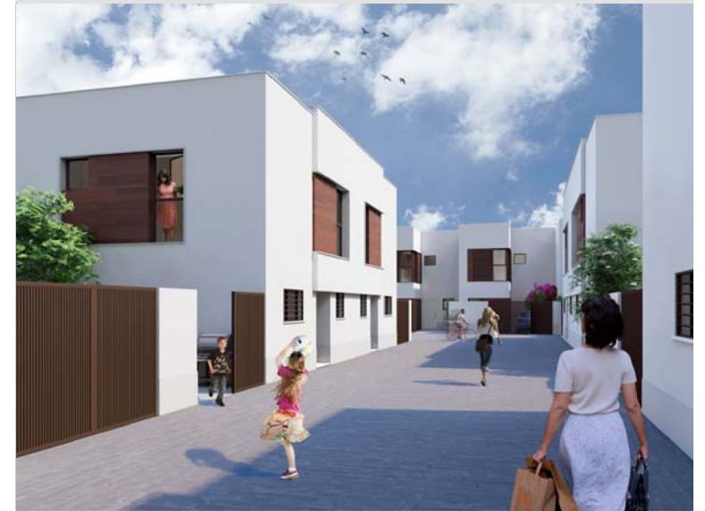
INFOGRAFÍA NO VINCULANTE